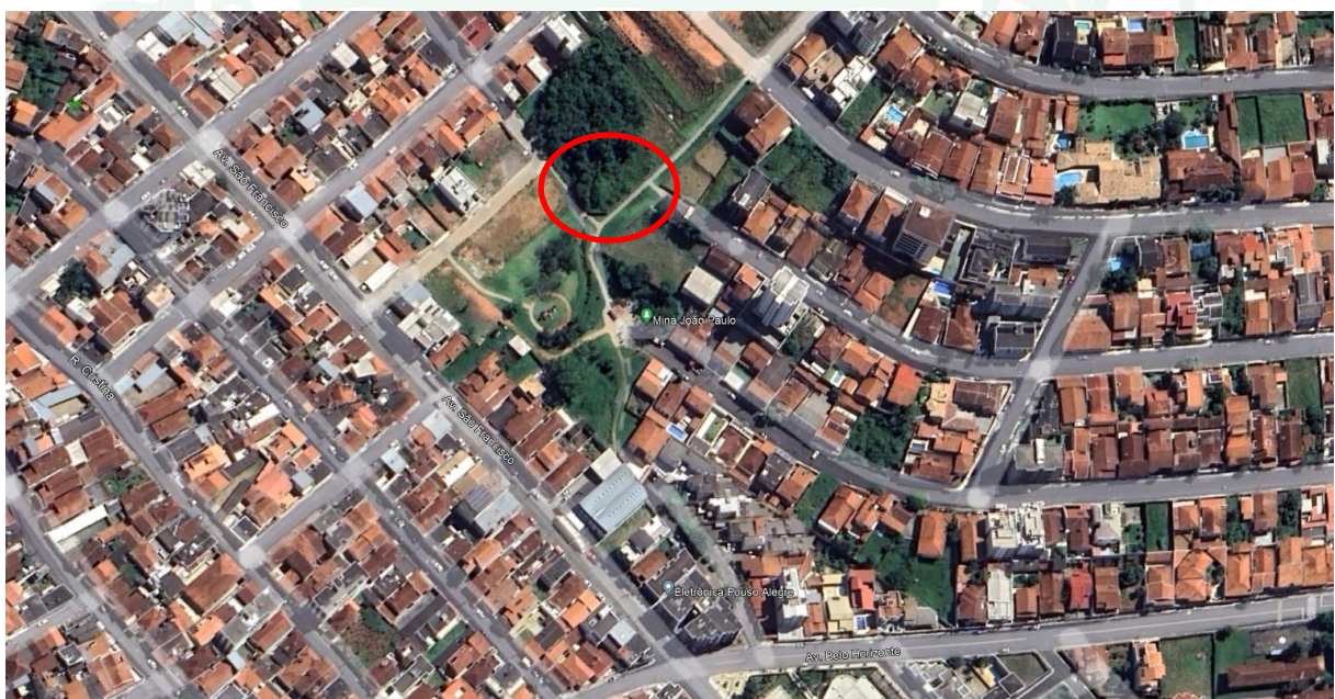
Figura 2 - Localização da Bacia

8.1. Os serviços serão executados no seguinte local: